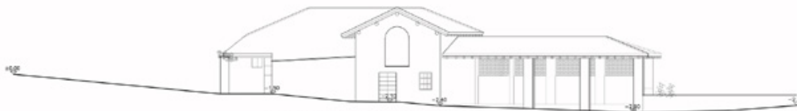
PROSPETTO SUD RUSTICI DA VIALETTO INTERNO