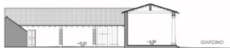
PROSPETTO EST DA CORTILE INTERNO