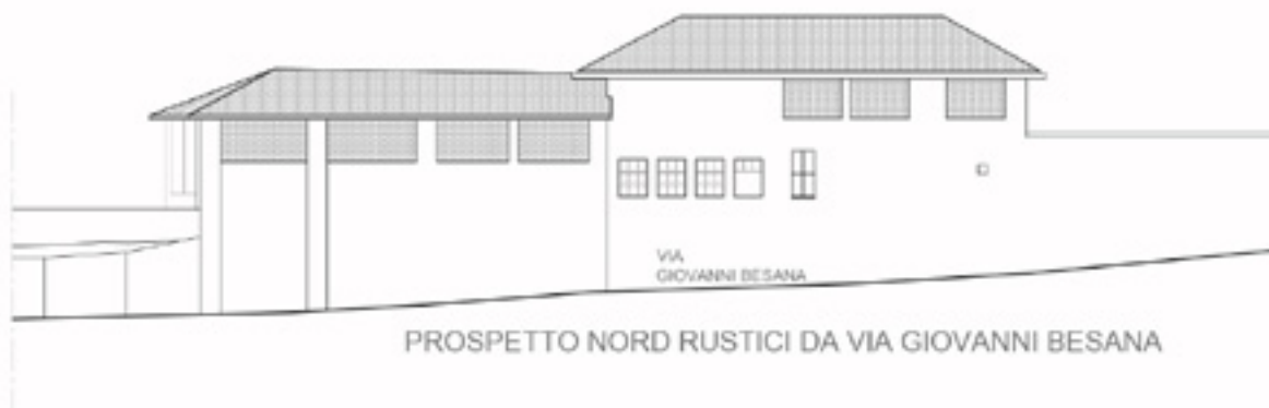
PROSPETTO NORD RUSTICI DA VIA GIOVANNI BESANA